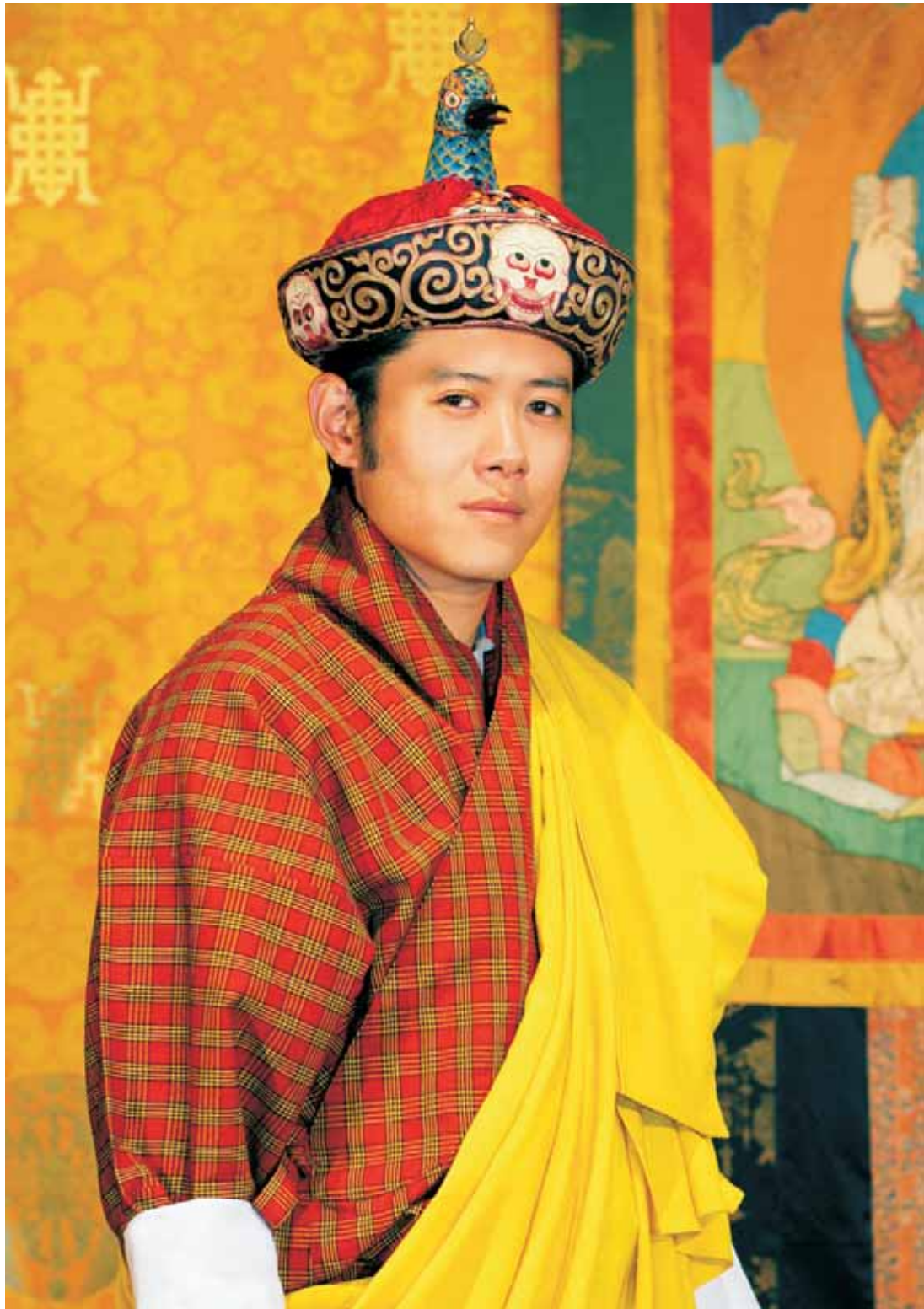
HIS MAJESTY JIGME KHESAR NAMGYEL WANGCHUCK